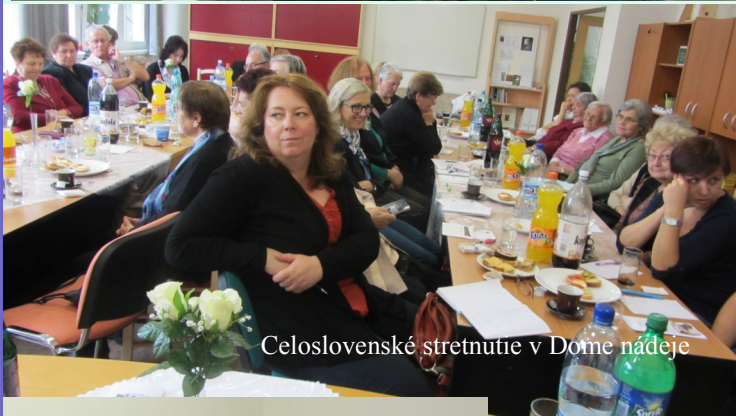
Celoslovenské stretnutie v Dome nádeje