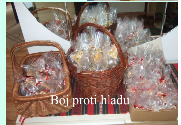
Boj proti hladu