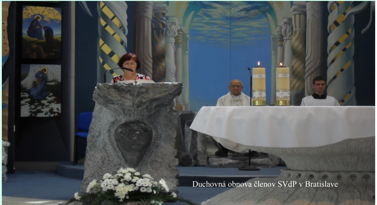
Duchovná obnova členov SVdP v Bratislave