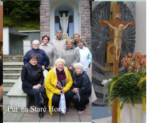
Púť na Staré Hory